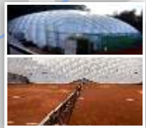
2-Platz Traglufthalle im Winter